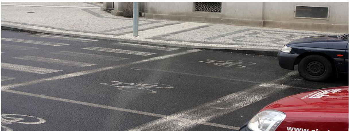
Рис. 7.2. Перехрестя з перевагою велосипедиста на кожній смузі руху.