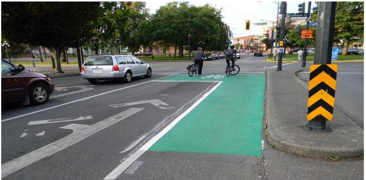
Рис. 7.1. Організація перехрестя шляхом надання переваги велосипедистам по крайній правій смузі.

Приклад облаштування велодоріжок на перехрестях, у вигляді велобоксу, враховуючи європейський досвід, зображено на Рис.7.1, Рис.7. 2.