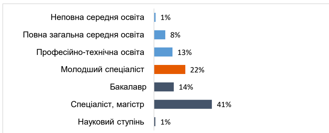
Рис. 2.1.2., % респондентів, які отримали ступінь освіти

Згідно дослідження GfK Ukraine – 2019 (опитування мешканців у місті Вінниця):